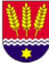
Gemeinde Alt Tucheband Ortsteil Hathenow