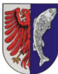
Gemeinde Küstriner Vorland Ortsteil Küstrin-Kietz