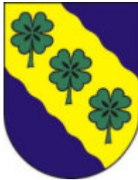
Gemeinde Alt Tucheband Ortsteil Alt Tucheband