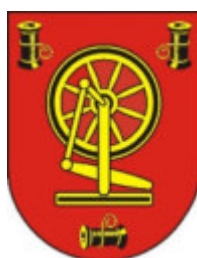
Gemeinde Zechin Ortsteil Buschdorf