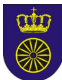
Gemeinde Zechin Ortsteil Friedrichsaue