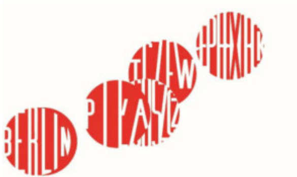
Arbeitsgruppe "Rundlokschuppen der Ostbahn" des Fördervereins Kamswyker Kreis e.V.