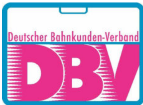
Deutscher Bahnkunden-Verband e.V. (DBV)